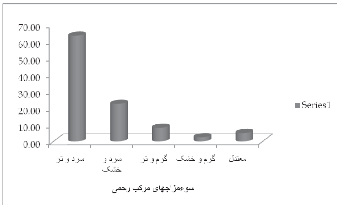
نمودار ب: فراوانی سوءمزاج‌های مرکب