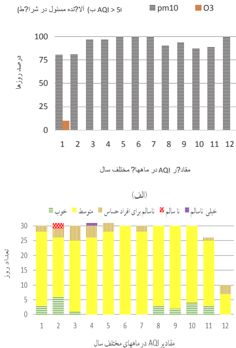
تصویر شماره ۲: (الف) مقادیر شاخص AQI در ماه های مختلف سال. (ب) آلاینده مسئول در شرایط AQI > 50

حاوی مقادیر غلظت SO_2 ، PM_{10} و PM_{2.5} برحسب (\mu g / m^3) در ۲۴ ساعت ماه های سال می باشد. این داده ها برای ارزیابی اثرات بهداشتی دو آلاینده توسط نرم افزار AirQ مورد نیاز بود.