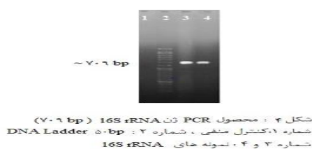
شکل ۴: محصول PCR ژن 16S rRNA (۷۰۳ bp) شماره ۱: کنترل منفی - شماره ۲: DNA Ladder ۵۰ bp شماره ۳ و ۴: نمونه های 16S rRNA

درصد فراوانی ژن‌های مورد بررسی در مطالعه حاضر به ترتیب fimH (۱/۸۷)، aer (۱/۸۵/۶) و papC (۱/۲۶) بود (شکل ۱، ۲، ۳).