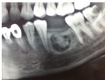
تصویر ۱: نمای پانورامیک ضایعه قبل از جراحی

در نمای بالینی تورم مختصر دردناک در سمت چپ مندیبل مشاهده گردید. مخاط دهان کاملاً سالم بود. بیمار تحت بیوپسی اکسیژنال قرار گرفت. بافت ارسال شده به آزمایشگاه حاوی چندین قطعه بافت نرم و سخت به رنگ کرم-قهوه‌ای در ابعاد ۲۵×۷×۵mm بود. بافت‌های نرم و سخت به ترتیب در محلول‌های فرمالین ۱۰٪ و اسید نیتریک قرار داده شدند.